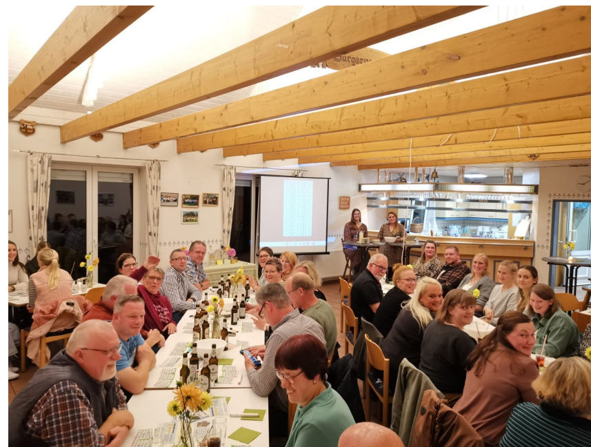
Bingoabend 2024 im DGH

Auf der Homepage können alle Termine und weitere Informationen nachgelesen werden. Auf aktuelle Veranstaltungen wird über Facebook, in der Zeitung und/oder durch Flyer zusätzlich hingewiesen. Im Mai laden wir zur Fahrradtour ein.